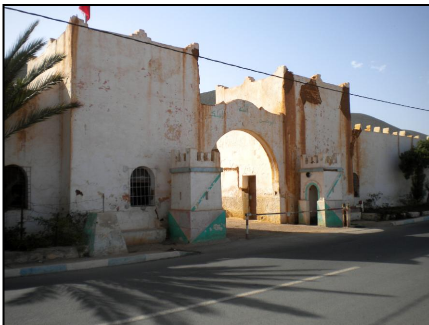
Figura 5. Aspecto actual de la entrada del antiguo cuartel de La Legión, desde el norte.