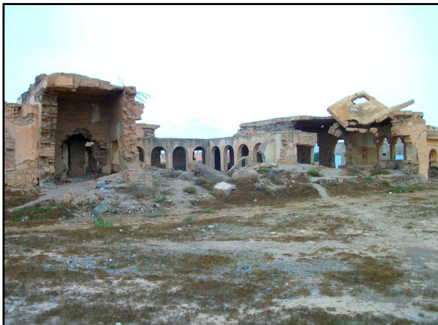
Figura 15. Vista de las ruinas de la edificación principal, desde el este. Se observa, en el centro, el patio interior porticado.

Su estado actual es completamente ruinoso, con la mayor parte de las estructuras derruidas a consecuencia de la acción destructiva de las fuerzas españolas. Aún así, es posible contemplar entre los escombros el patio interior porticado del antiguo destacamento y otras dependencias.