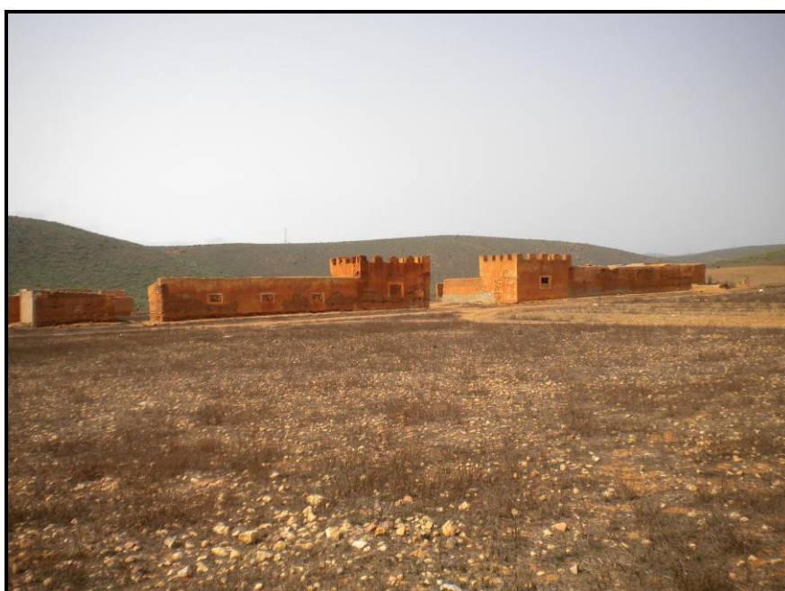
Figura 8. Entrada del campamento de Id Nacus en la actualidad, desde el suroeste.

Se mantiene en la actualidad en aparente buen estado de conservación pese a su completo abandono, con las estructuras arquitectónicas en pie y la mayor parte de los vanos tapiados.