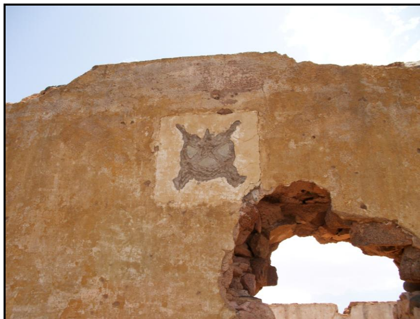
Figura 10. Detalle de la huella del emblema de Tiradores de Ifni nº 1 en una de las fachadas de la posición, desde el oeste.