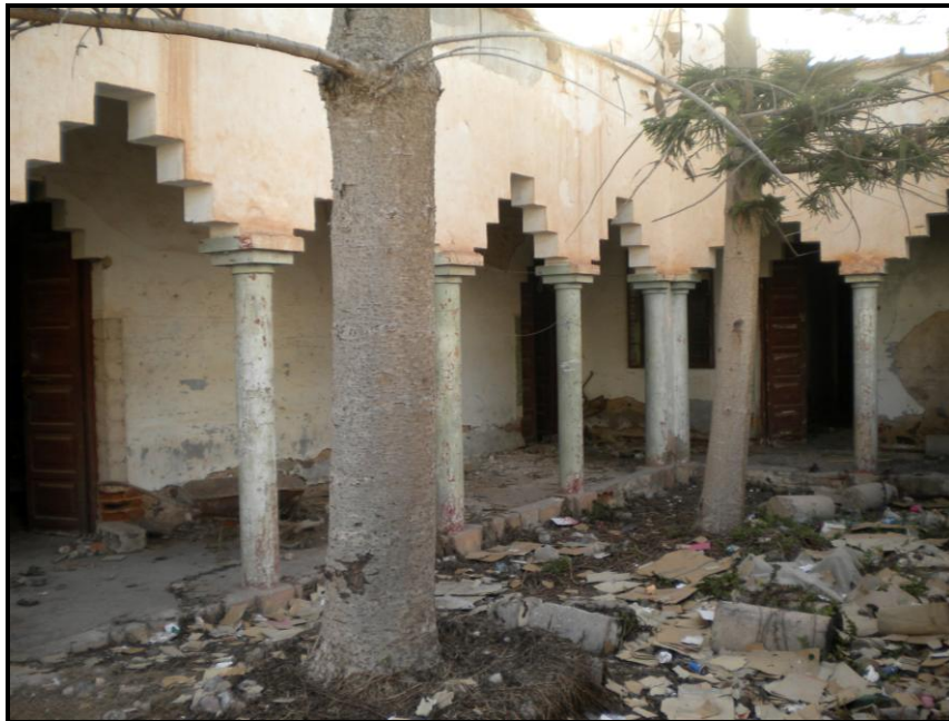
Figura 3. Vista del estado de abandono del pequeño patio de la zona este.

Las instalaciones presentan un estado de completo abandono, aunque manteniendo intactas sus estructuras arquitectónicas, tanto las fachadas exteriores como las dependencias interiores, patios y la garita de la esquina este.