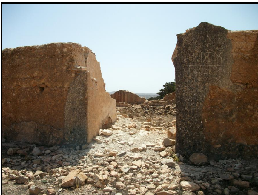
Figura 12. Detalle de los restos del arco de herradura de la entrada, desde el oeste.