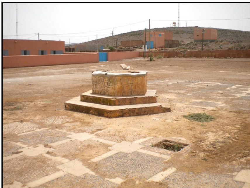
Figura 14. Vista actual del pozo y el empedrado del antiguo puesto de Policía, desde el noroeste. Al fondo, el cerro del cuartel de Tiradores.

El estado de conservación actual es de completa ruina, estando instalados sobre los restos del cuartel de Tiradores un depósito de agua y una antena de telecomunicaciones. En el de Policía, tan sólo son visibles el pozo y el empedrado del antiguo patio interior.