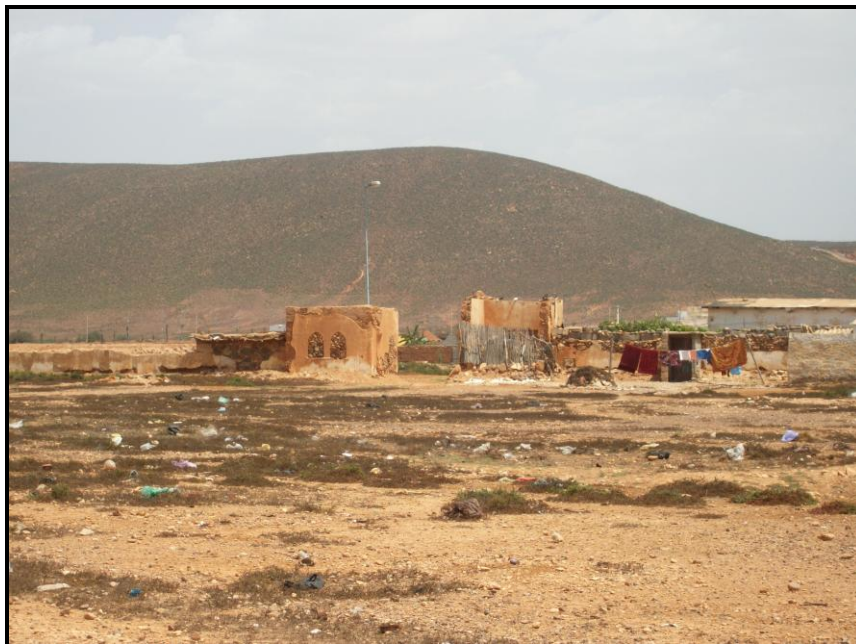
Figura 2. Vista del campamento en la actualidad, desde el noroeste.

Actualmente se mantiene en ruinas y completamente abandonado, siendo aún perceptibles los restos de la entrada y de las estructuras pétreas de las chozas y tiendas.