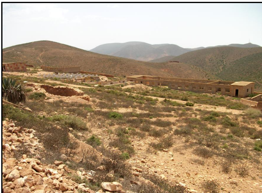
Figura 9. Precario estado actual de las instalaciones del Coraima, desde el noreste.

Su estado actual es precario y ruinoso, sirviendo algunas zonas de su espacio interior para la colocación de panales para cultivo apícola.