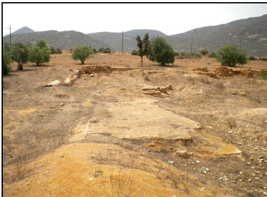
Figura 13. Restos de la zona principal del destacamento de Tenin de Amel-lu, desde el este. Al fondo, el yebel Taulacht.