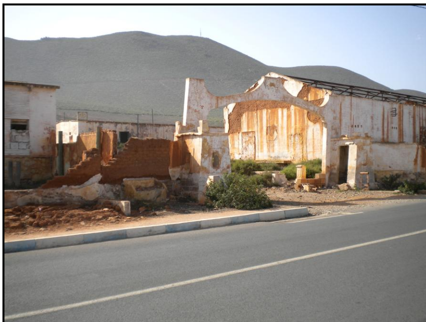
Figura 6. Entrada del antiguo acuartelamiento de Tiradores de Ifni nº 2 en la actualidad, desde el norte. Al fondo, el yebel Bu Laalam.