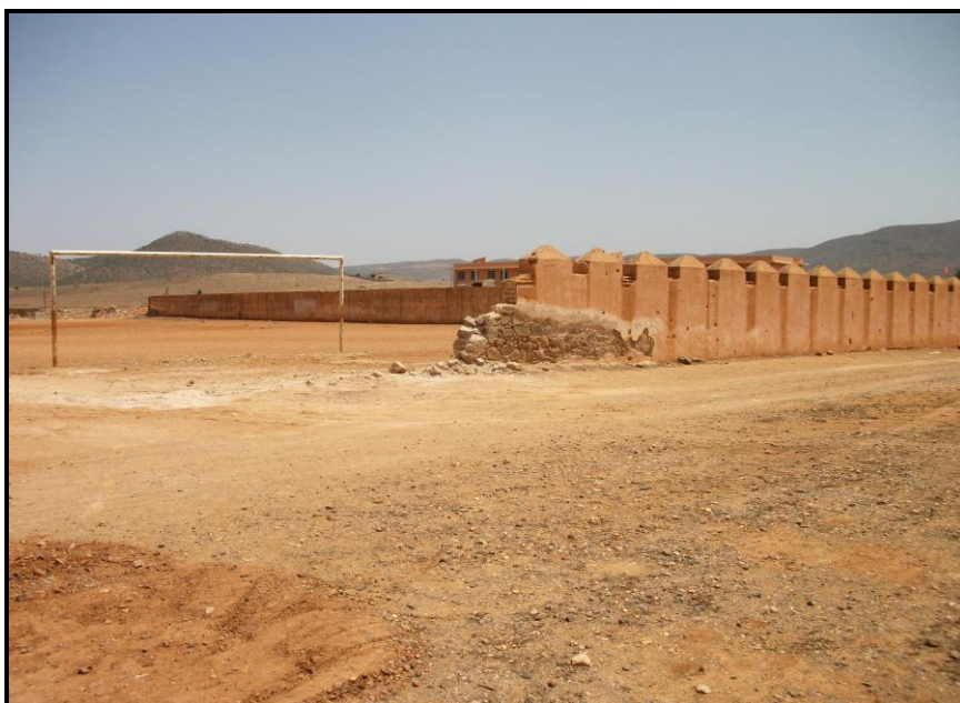
Figura 11. Muro perimetral del cuartel de Tiradores en la actualidad, desde el suroeste.