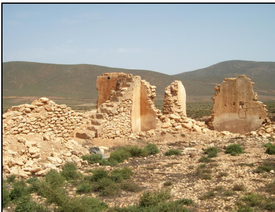
Figura 7. Vista de las estructuras derruidas del ángulo interior sureste, desde el noroeste.

En la actualidad, la fortificación presenta un estado de completa ruina y abandono, con todas sus estructuras derruidas. En su entorno sur, se conservan varios restos atrincherados del sistema defensivo inicial de Sidi Ifni de los acontecimientos bélicos de 1957. El precario estado en el que se mantienen los restos arquitectónicos del antiguo fuerte de Aman U Ali es un hecho que se viene comprobando en los últimos años, con el constante y acentuado derrumbe de todos sus lienzos y demás estructuras.