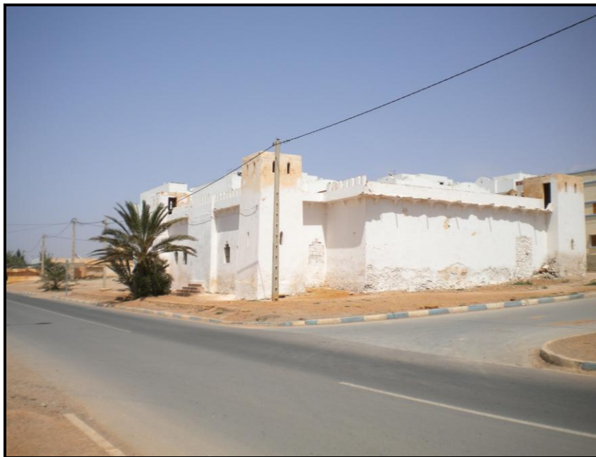
Figura 4. Vista de la antigua cárcel en la actualidad, desde el suroeste.

Actualmente mantiene toda su estructura arquitectónica intacta, aunque en un estado de abandono manifiesto, con algunos de los escasos vanos y la entrada tapiados.